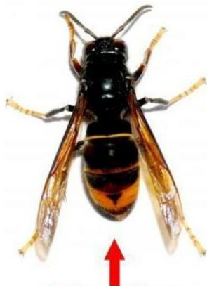
Frelon asiatique (taille réelle 3 cm)

On observe depuis plusieurs années, une réduction du nombre d'apiculteurs et du nombre d'abeilles en France.